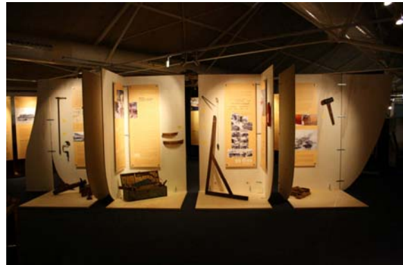
Suport expositiu central cara exterior