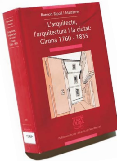
A — Portada del llibre L'arquitecte, l'arquitectura i la ciutat: Girona 1760-1835