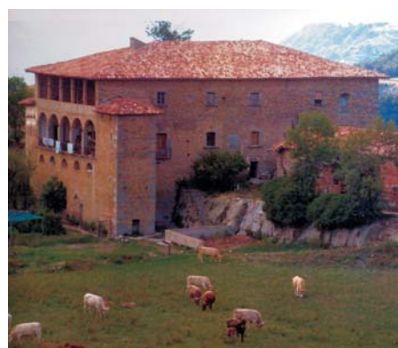
A — Fotografia: Mas Coll de la Parroquia de Sant Hilari de Vidrà (Ripollès), Ignasi C. Permanyer

Ignasi C. Permanyer, notari de professió i genealogista de vocació, ens ha fet arribar el seu treball "Arbre genealògic de la família Plana, Sabatés i Vernatalat", en el qual a més de l'arbre, s'hi acompanyen totes les referències documentals que permeten l'elaboració de la genealogia, així com també imatges dels diferents masos i cases pairals de les comarques del Ripollès, Osona, Garrotxa, Pla de l'Estany, Gironès i Berguedà, relacionats amb aquella. El treball està a disposició de totes les persones que tinguin interès en consultar-lo.