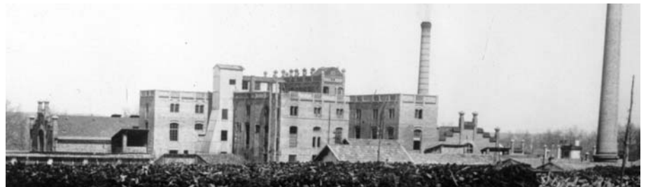
A — Fotografia: Fàbrica Pagans, Celrà

conté projectes d'acotament d'arrossars i molins arrossers de Pals i projectes de la Comissió Mixta, que corresponen a obres de les zones regables del Ter i estudis de viabilitat del Pla de regadiu dels marges del Ter, 9 capsos.