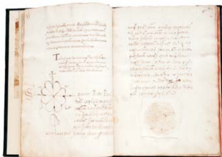
A — El Llibre de Privilegis de Palafrugell

Els escolars d'ESO m'han preguntat també si encara quedava alguna cosa per recuperar. I aquí la resposta ja ha estat més complicada. Quan vaig començar a treballar a l'Arxiu una de les feines a fer era resseguir les vicissituds del fons de