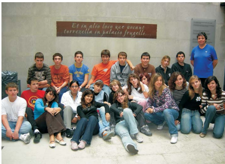
A — Fotografia: 4t curs d'ESO del col·legi Sant Jordi de Palafrugell.

I més, encara. I la història no ha acabat. Ens falten alguns llibres d'actes anteriors a 1827, i alguns llibres de clavari, per exemple; i és difícil saber quina documentació es va perdre amb la crema que va patir l'església durant la guerra civil, quina va volar pels efectes de la tramuntana o es va fer servir per encendre l'estufa a la primera Biblioteca municipal, quina pot estar encara en alguna biblioteca particular o arxiu patrimonial —potser sense saber-ho els actuals propietaris— i quina continua en el mercat de compravenda sense que ens n'assabentem. Recuperarem més documentació? N'hi ha prou amb fer butlletins, amb l'edició de llibres, amb exposicions, amb visites escolars, amb la legislació i les pràctiques actuals per aconseguir-ho?