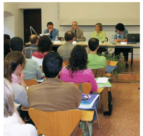
A — Fotografia: Dani Bosch

per a la recerca històrica en múltiples i variats temes. Al mateix temps vam poder intercanviar experiències amb els arxivers francesos dels Arxius Departamentals de Perpinyà, amb els quals ens uneixen qüestions històriques que es reflecteixen en una documentació semblant quant a fons notariales, a part dels temes professionals que fan referència al treball arxivístic de descripció i classificació d'aquests fons. Properament es publicarà el llibre amb les ponències i les comunicacions de les Jornades.