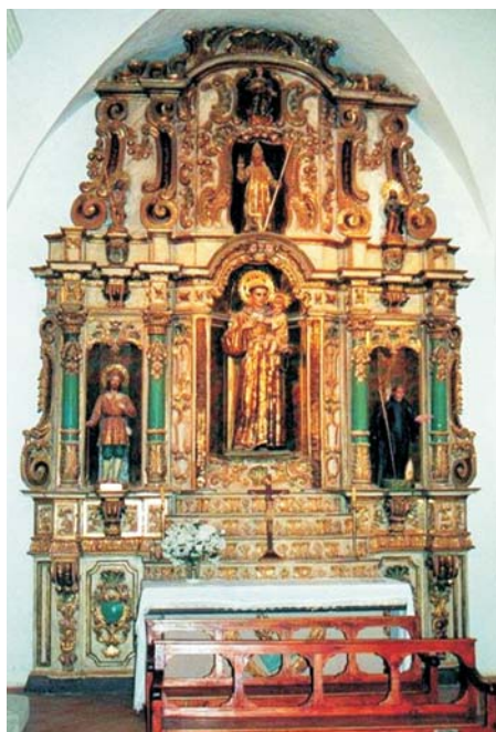
A — Retaule de Sant Antoni de Pàdua de l'església de Sant Gregori (Gironès).