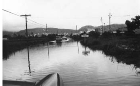
A — La plana de l'Empordà sota les aigües. Fotografies trameses pels ajuntaments de Castelló d'Empúries i de Roses al Govern Civil de Girona, sobre els efectes de les inundacions de 1965.

va, si és el cas, peticions d'ajuda al govern i gràcies a la competència atorgada per la llei de 18 de juny de 1885 i el reglament de 30 d'agost del mateix any, té la potestat d'eximir els ajuntaments afectats del pagament de la contribució territorial.