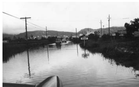
A — El Empordà bajo las aguas. Fotografías enviadas por los ayuntamientos de Castelló d'Empúries i de Roses al Gobierno Civil de Gerona, los efectos de las inundaciones de 1965.

ta el reparto de las ayudas otorgadas. La Diputación, en caso que sea necesario, eleva al Ministerio correspondiente las peticiones de ayuda y gracias a la competencia otorgada por la ley de 18 de junio de 1885 y el reglamento de 30 de agosto del mismo año tiene la potestad de eximir a los ayuntamientos afectados del pago de la contribución territorial.