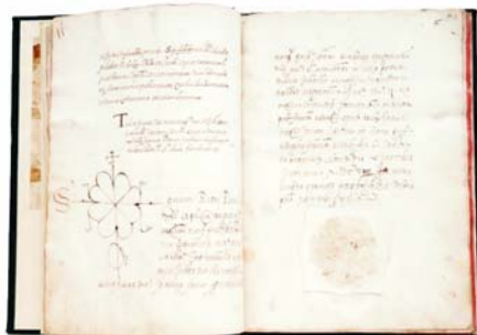
A — Fotografía: Enric Bruguera. El Llibre de Privilegis de Palafrugell

ta en una librería de libros antiguos el año 1926 y apelaba a la usucapió o prescripción adquisitiva) y los del Ayuntamiento (que defendía que la acción de reclamación o reversión del libro no había prescrito y como consecuencia se debería aplicar el principio de procedencia o principio de respeto al fondo).