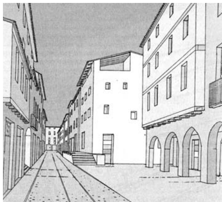
A — Ilustración del libro L'arquitecte, l'arquitectura i la ciutat: Girona 1760-1835

trabajos a aspectos concretos del urbanismo de la ciudad de Girona en los siglos XVIII y XIX, nos ofrece ahora en esta obra una síntesis de su tesis doctoral. No se trata únicamente de un estudio de la evolución urbanística de la ciudad sino que el trabajo va más allá, abordando aspectos que rebasan el interés estrictamente local. El autor estructura el libro en tres partes. La primera se centra en los profesionales de la construcción de este periodo, muy ligados al mundo gremial de raíz medieval, y todo lo que representó la aparición de la figura del arquitecto "académico", resultado del espíritu racionalista de la Ilustración, con el cual se ponen las bases de una nueva concepción en el campo de la construcción.