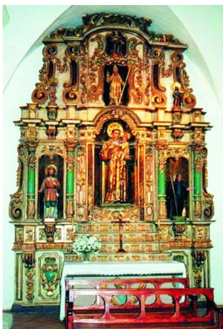
A — Retablo de Sant Antonio de Padua de la iglesia de Sant Gregori (Gironès)