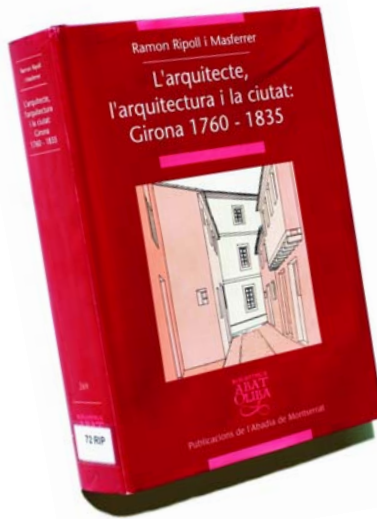
A — Portada del libro L'arquitecte, l'arquitectura i la ciutat: Girona 1760-1835