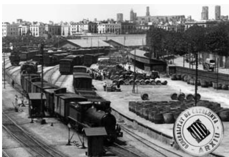
A — Fotografía: Portada catálogo de la exposición "El retorn dels documents confiscats a Catalunya"

Del 24 de Octubre al 19 de Noviembre los gerundenses pudieron visitar en el Centro Cultural la Mercè la exposición "El retorn dels documents confiscats a Catalunya", organizada por el Departamento de Cultura de la Generalitat. En la muestra se ha podido ver una selección de documentos procedente de las 507 cajas del archivo de Salamanca devueltas a Catalunya y algunas reproducciones de documentos de particulares y de entidades que se devolverán en una segunda fase.