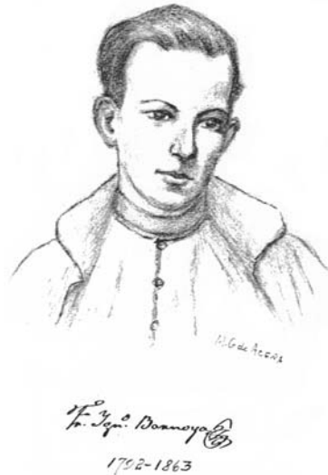
A — Retrato en lápiz de Fray Ignasi Barnoya, de Mercedes Guirola Leal de Aceña Durán —

con sueldo de 20 reales diarios; se ahogó en 1829 en una inundación en Hostalric, donde dirigía unas obras de fortificación.