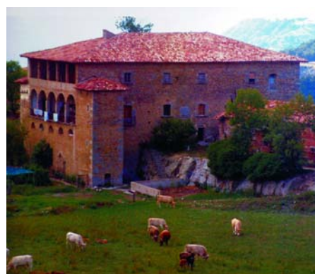
A — Fotografía: Mas Coll de la Parroquia de Sant Hilari de Vidrà (Ripollès), Ignasi C. Permanyer

Ignasi C. Permanyer, notario de profesión y genealogista de vocación, ha donado al archivo un ejemplar de su trabajo "Árbol genealógico de la familia Plana, Sabatés y Vernatallat," en el cual además del árbol, se acompañan todas las referencias documentales que permiten la elaboración de la genealogía, así como también imágenes de las diferentes masías y casas solariegas de las comarcas del Ripollès, Osona, Garrotxa, Pla de l'Estany, Gironès y Berguedà, relacionados con aquella. El trabajo está a disposición de todas las personas que tengan interés en consultarlo.