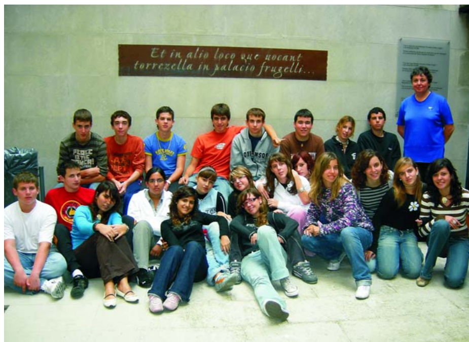
A — 4º curso de ESO del colegio Sant Jordi de Palafrugell.

Y más... y la historia continúa. Por ejemplo, nos faltan algunos libros de actas anteriores a 1827 y algunos libros de clavería. Resulta difícil saber cuanta documentación se perdió en el incendio que sufrió la iglesia parroquial durante la guerra civil, cuantos documentos volaron por los efectos de la tramontana o cuántos se utilizaron para encender la estufa en la primera biblioteca municipal; tampoco conocemos los que pueden estar todavía en alguna biblioteca particular o archivo patrimonial —quizás sin conocimiento de los actuales propietarios— y los que continúan en el mercado de compraventa sin que nos enteremos. ¿Recuperaremos más documentación? ¿Es suficiente el esfuerzo que se realiza para dar a conocer el archivo a través de la difusión de boletines informativos, la edición de libros, con exposiciones, con visitas escolares. ¿Es suficiente el amparo de la legislación y las prácticas actuales para conseguirlo?